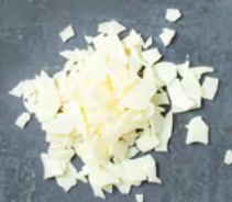
Schokoraspel weiße Schokolade